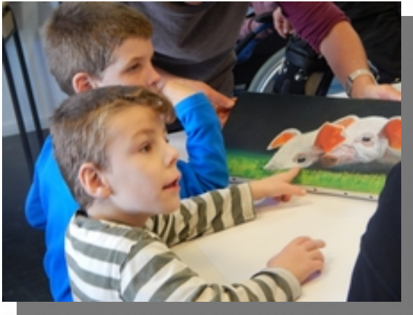
Secteur enfance et adolescence

Ce sont plus de 1100 personnes accueillies et accompagnées chaque jour par 750 professionnels des établissements et services de l'association sur 3 secteurs