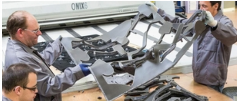
Secteur travail et vie professionnelle