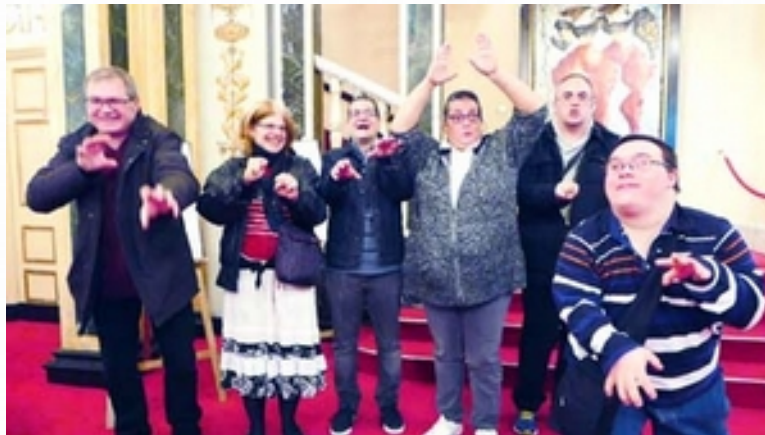
Secteur hébergement et vie sociale